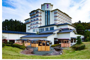
平成7年7月7日にオープン。新たなスタイルを提供していきます。

当社は昭和39年創業の宿泊業です。平成7年に秋保温泉にて「奥州秋保温泉 蘭亭」をオープンし28年目となりました。当館では「人に優しいハートフルな宿」として、お年寄りや小さなお子様連れのご家族が気兼ねなく過ごせる環境を提供しています。お客様が喜んでいただけるようにご予約の時から徹底したヒアリング、子育て中のスタッフや世代の近いスタッフの意見も取り入れて魅力あふれるおもてなしをしています。お客様へ、だけではなくスタッフ間や取引先の方へも優しく対応できるのは日ごろのコミュニケーションの成果です。社長もスタッフも楽しく学び続ける姿勢を忘れず、私たちは常に成長していきます。