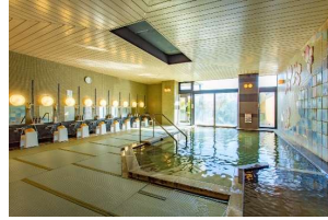
お子様やお年寄りのお客様も滑らず安心の「畳風呂」です。