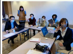
最前線を知っている講師を呼んで、楽しく学びます。