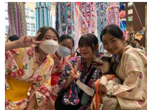
外国人スタッフとも仲良く仙台七ヶへ。SNSでもアピール！