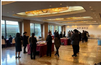
新年会も実施して交流を深めます。働きやすい環境が出来てきました。