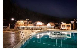
2022年9月にオープンした人気のグランピング施設。