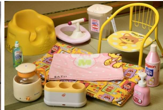
充実した備品で子育て中のご家族も気兼ねなく過ごせます。