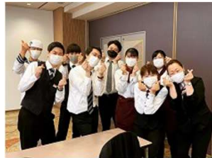
社員それぞれが特技を活かして楽しくお迎えいたします。