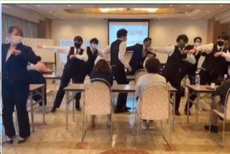
蘭亭の会議ではみんながつい踊りだしちゃうことも？